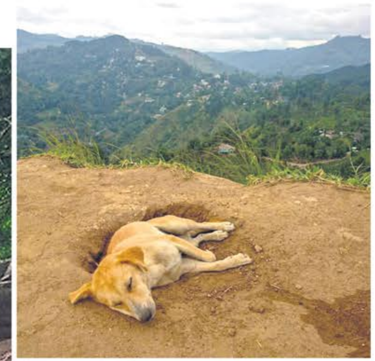
Puno je pasa u divljini