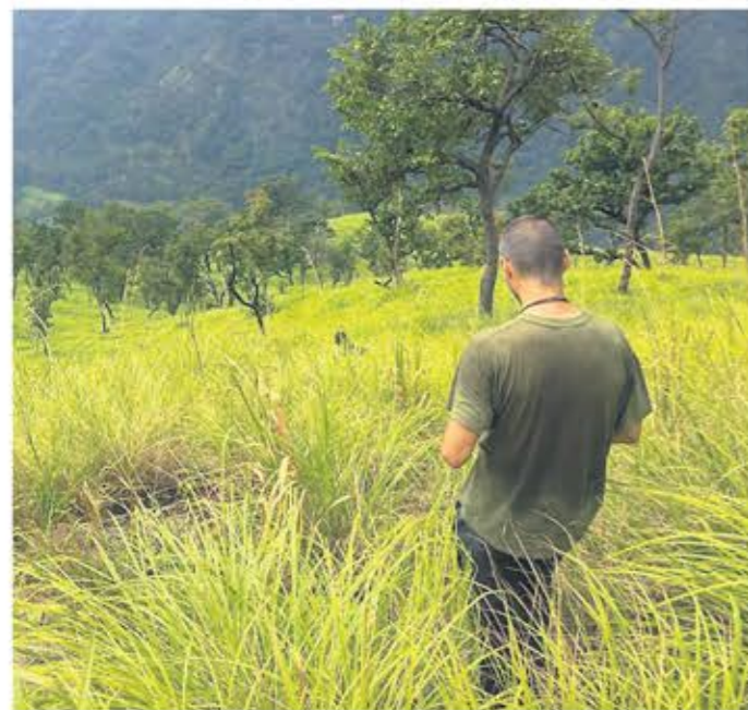
Hrabro kroz šaš

“Ovi su upravo otišli na neku rijeku provjeriti koliko su krokodili aktivni na određenoj dionici. Nije ih omelo upozorenje lokalaca da je bilo napada na ljude i da nije sigurno. Možda imaju ugovoren sastanak s glavnim krokodilom pa će zamoliti primirje u terminu utrke. Nisam baš na istoj valnoj duljini s njima oko sigurnosti natjecatelja.” - stiže mi nova poruka.