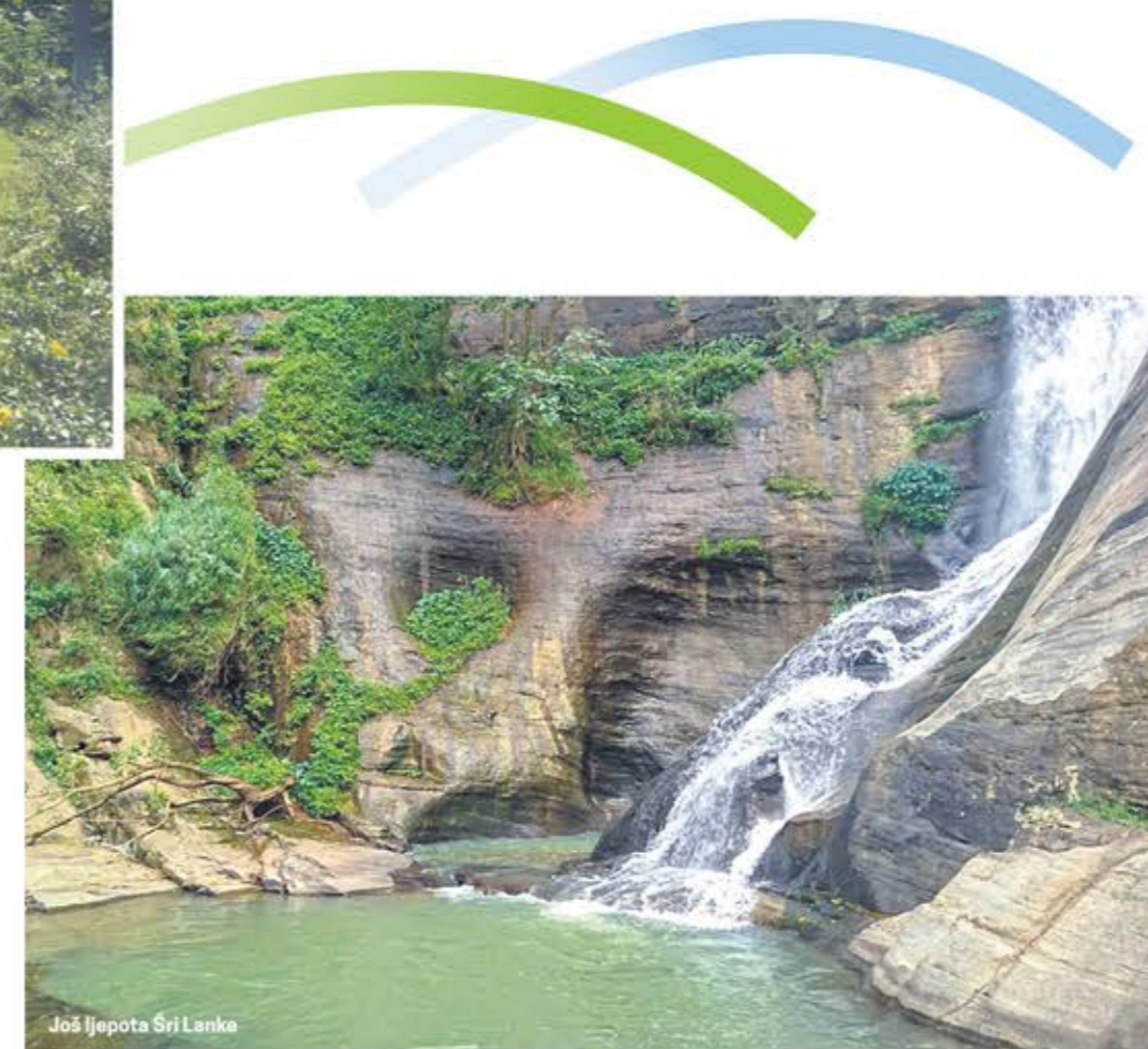
Još ljepota Šri Lanke